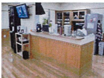
キッチンカウンター