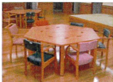
食堂・六角テーブル&イス