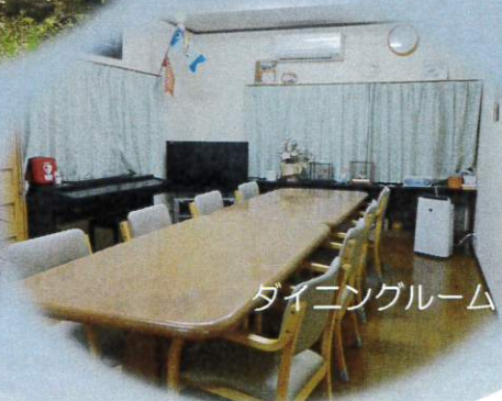
ダイニングルーム