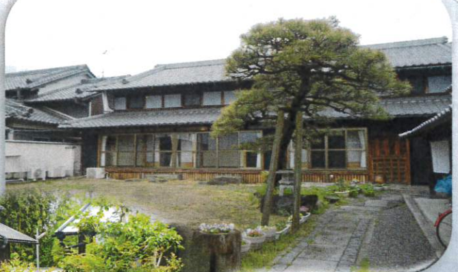
「なごみ筒井」の風景